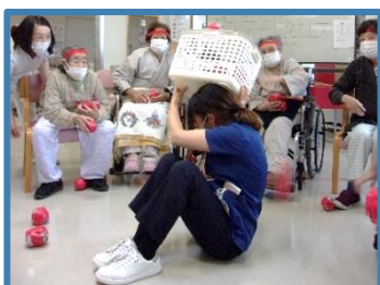
患者様の勢いに圧倒されるスタッフ

患者様の生き生きとした表情や笑顔を見ることができ、職員一同も大変嬉しく思いました。